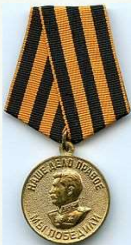
Медаль за победу над Германией в Великой Отечественной войне 1941-1945