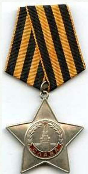
Орден Славы 3 степени